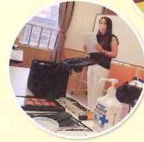
写真:上・左 これまでの 活動の様子